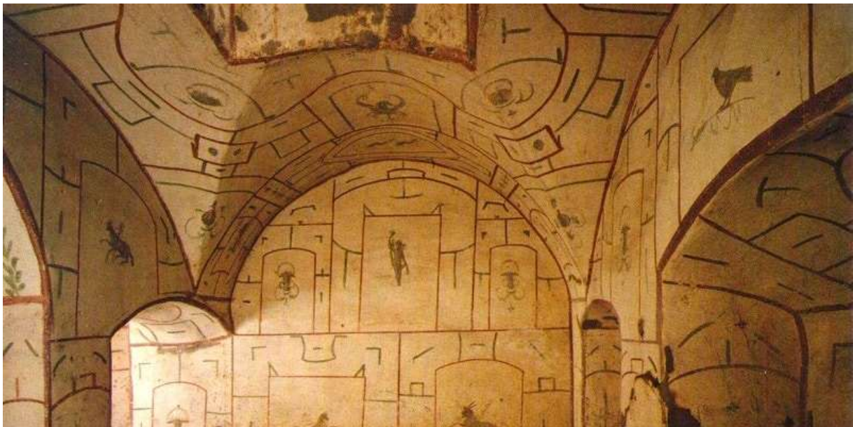
Catacombe San Sebastiano à Rome

Au second étage de ces catacombes reposait le corps de Saint Sébastien. Il fut transféré dans la Basilique des Apôtres lors de la construction de celle-ci au 5 ème siècle. Une tradition chrétienne rapporte en effet qu'en 258, au cours des persécutions de Valérien, les reliques de Pierre et Paul furent placées temporairement dans ces catacombes appelées à cette époque « Memoria Apostolorum », des graffiti sur les murs attestant du culte des deux saints. Cette basilique prit le nom de Saint Sébastien au 11 ème siècle.