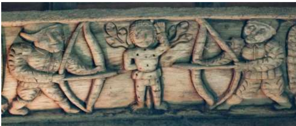
Sablère du transept de la chapelle Saint Sébastien du Faouët 1598

La plupart des Compagnies d'Arc se regroupent sous la bannière de Saint Sébastien mais quelques-unes ont conservé leur attachement à Saint Georges.