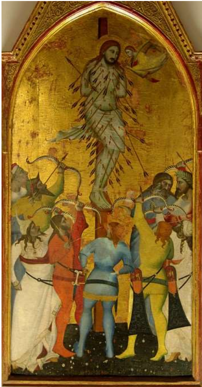
Le martyre de Saint Sébastien Giovanni Del Biondo (vers 1380)